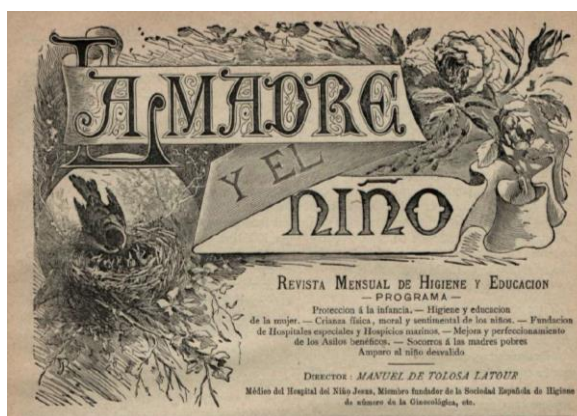
Figura 2. Encabezado de la revista diseñado por José María Riudavets.