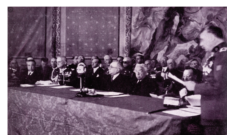
Mesa presidencial en la sesión de apertura del VII Congreso Internacional de Medicina y Farmacia Militares (Madrid, 1933). Asistieron S. E. el Presidente de la República y los Sres. Ministros de la Guerra y Marina. Gaceta Médica Española, 82, Jul. 1933